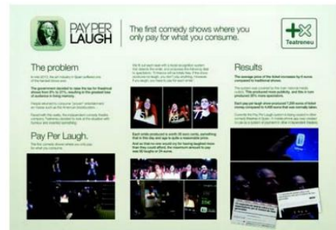
Pay Per Laugh. Una cámara/pantalla en cada butaca y el precio de la entrada según las sonrisas del espectador.

¿Cuánto más hemos vendido gracias a un anuncio publicado en la edición