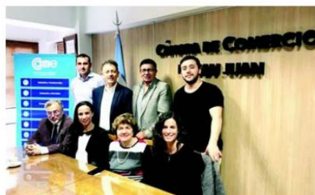
Representantes de la Cámara sanjuanina y de la REDBdA.

Quedó consolidada la iniciativa impulsada por la Cámara de Comercio e Industria provincial.