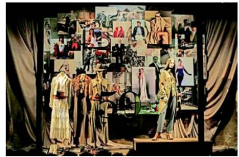
La vidriera Ralph Lauren, una de las premiadas en los WindowsWear Awards.

Estos equipos se manejan a partir de un abono mensual, que abarca entrevistas previas, propuestas y montaje de las vidrieras. La inversión resulta fácilmente recuperable, teniendo en cuenta la relación costo/beneficio.