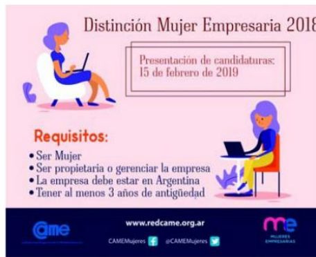
El afiche de la convocatoria.

Mujeres Empresarias de la CAME anuncia que se encuentra abierta la inscripción para la distinción Mujer Empresaria 2018, cuyo objetivo es la motivación de la mujer en el mundo empresarial, reconociendo su trayectoria y proyectos que incentiven la actividad de las pequeñas y medianas empresas.