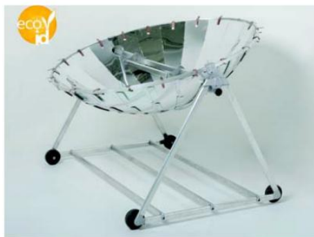
CocinAR, cocina solar parabólica y portátil.

Eco-iD -participante del concurso «Poné tu energía para cuidar el ambiente» de CAME- ofrece, entre otros productos, cocinas solares con materiales reciclados y generadores portátiles.