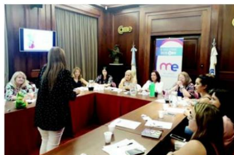
Encuentro de trabajo y capacitación en la sede de la CAME.

El orden del día incluyó la optimización de la comunicación interna, la difusión de la agenda de actividades y la planificación del Día de la Mujer.